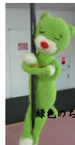
緑色のちゃらまる